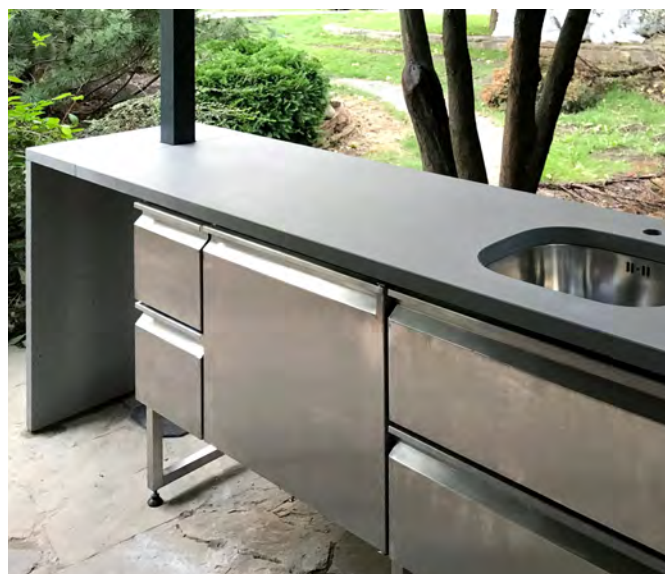
Прибудинкове барбекю м.Харків. Стільниця CONC.

Матеріал: високоміцний фібробетон CONC Обробка: травлення, шліфування, захисне покриття від плям.