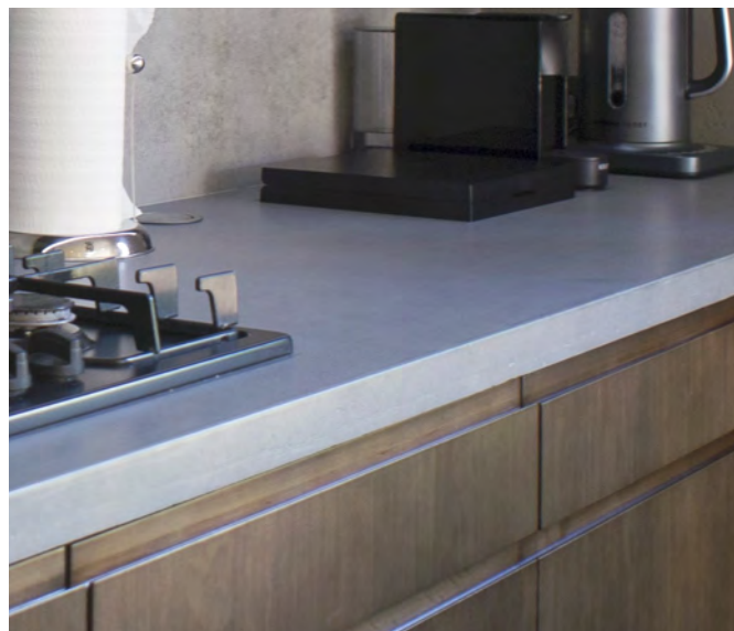
Приватний будинок м.Київ. Стільниця CONC.