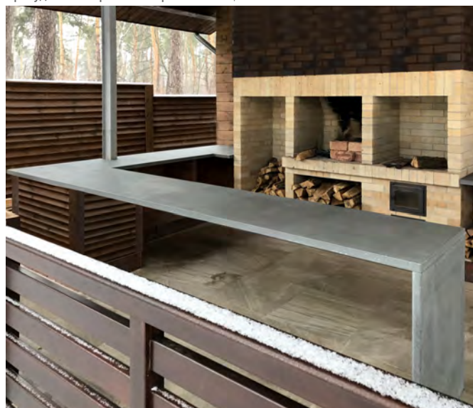
Веранда житлового будинку. м.Київ. Стільниця CONC.

Столешні стійкі до вологи та ультрофіолетового випромінювання. Через це відмінно пасують для застосування у інтер'єрах та на відкритому повітрі.