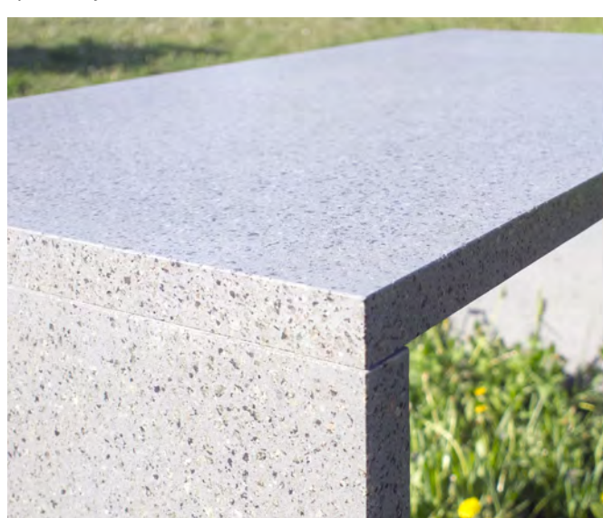
Веранда житлового будинку. м.Київ. Стільниця CONC.