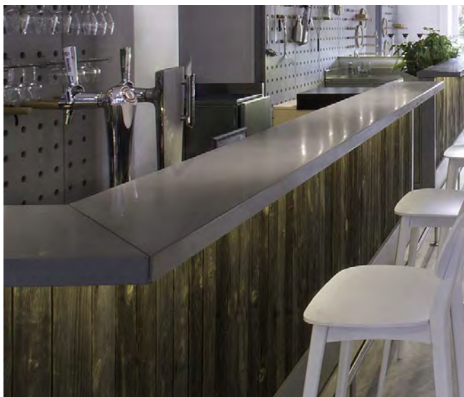
Cafe Tres м. Монтрє, Швейцарія. Стільниця CONC.