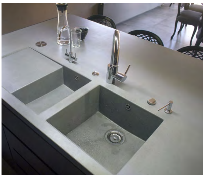
Приватний будинок м.Київ. Стільниця CONC.

Виробляються в Україні із компонентів зі Швейцарії, Америки та відчизняних складових.