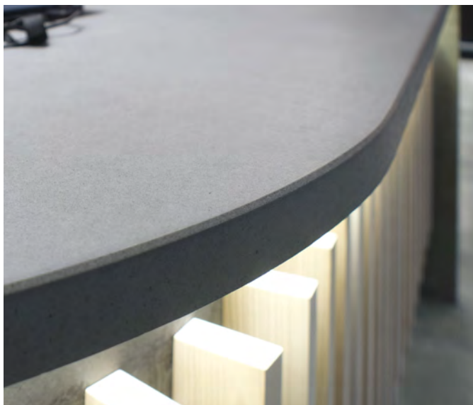
Офіс банку. м. Київ. Стільниця CONC.

Високоміцні бетонні стільниці з сучасного екологічного матеріалу Фрагменти виконаних робіт