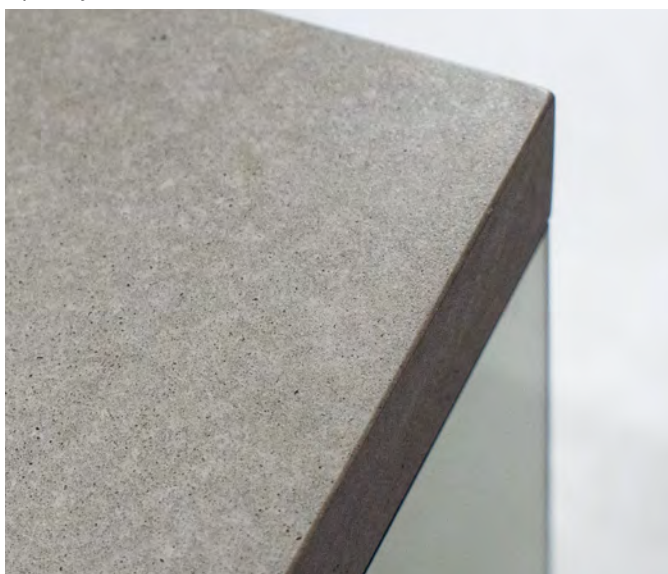
Приватний будинок м.Київ. Стільниця CONC.