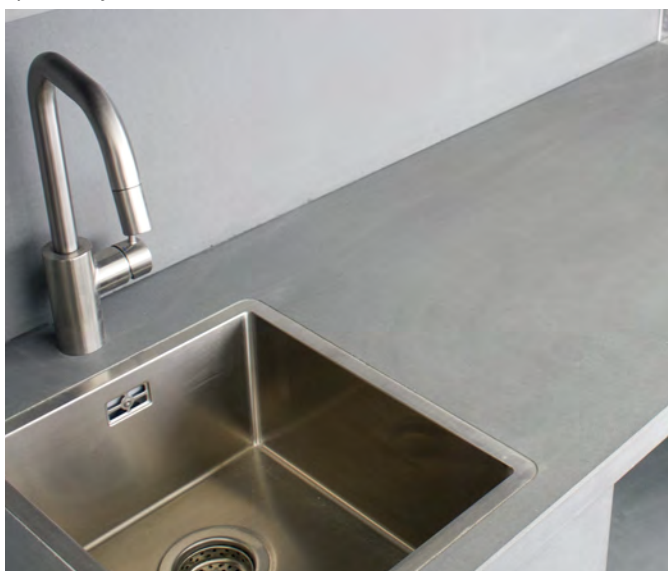
Веранда житлового будинку. Київська область. Стільниця CONC.