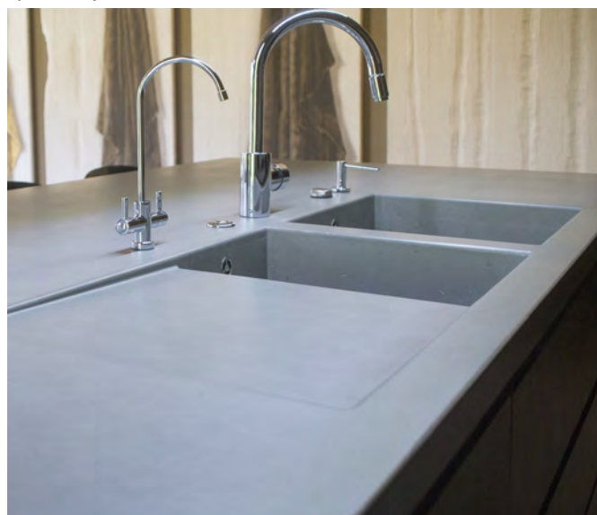
Приватний будинок м.Київ. Стільниця CONC.